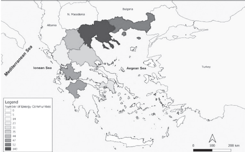
Σχήμα 1: Υπάρχουσες Ε. Κοιν. στην Ελλάδα ανά περιφέρεια, 2020