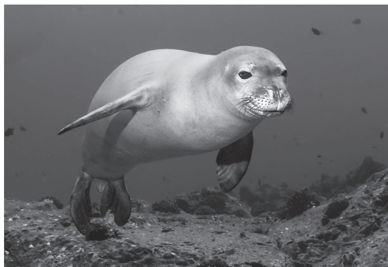
Απειλείται και από τη βιομηχανική ρύπανση η φώκια της Κασπίας

Όπως δήλωσαν Ρώσοι εμπειρογνώμονες , ο θάνατος των ζώων μπορεί να οφείλεται σε «διαφορετικές εξωγενείς αιτίες» ή «σε μια