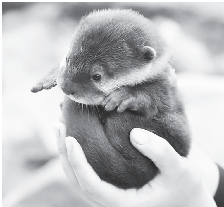
Οι ενυδρίδες ζουν μόνο εκεί, όπου η φύση παραμένει ...άθικτη!

Η ευρωπαϊκή ενυδρίδα ( Lutra lutra ) είναι ένα μικρό-