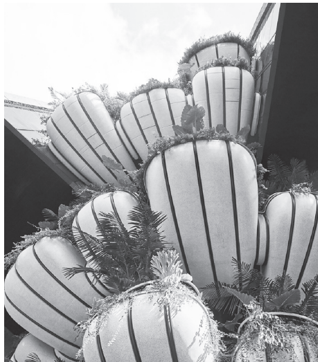
Μπαλκόνια σε σχήμα κοχυλίου, που λειτουργούν σαν γιγαντιαίες γλάστρες στην ...Εδέμ!

Οι ευφάνταστοι και, όπως φαίνεται, λάτρεις του πράσινου αρχιτέκτονες θέλησαν (και τα κατάφε-