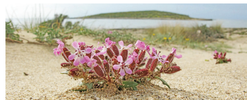
Το ενδημικό είδος Saponaria jagelii , που φύεται στην Ελαφονήσο και πουθενά αλλού σε όλο τον πλανήτη.

Πέραν όμως όσων προβλέπονται από τη νομοθεσία, το πλέον προβληματικό σημείο είναι το μήνυμα που περνάει αυτή η ενέργεια στο ευρύ κοινό, καθότι, σε ώρα υψηλής τηλεθέασης και σε δημοφιλή για τη νεολαία εκπομπή, με σκοπό την προώθηση ως πρότυπο lifestyle την οδήγηση μηχανοκίνητων οχημάτων, καθώς και την προώθηση συγκεκριμένου προϊ-