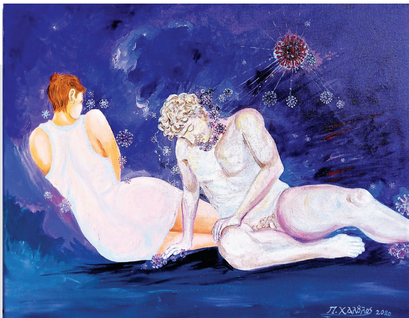
«Ο εφιάλτης μας-2020», Παναγιώτης Χαλούλος

Μετά από μεγάλο χρονικό διάστημα αδράνειας ήρθε η εικαστική έμπνευση. Για να δηλώσει τον «εφιάλτη» μας, που στοιχειώνει τη ζωή μας τη χρονιά που παραδίδει τη σκυτάλη στη νέα, η οποία ελπίζουμε, μέσω του εμβολιασμού μας, να μας λυτρώσει, φυσικά και με την τήρηση εκ μέρους μας των ενδεδειγμένων μέτρων προφύλαξης.