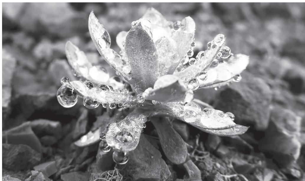
Σταγόνες δροσιάς!

Μέχρι σήμερα, δεν υπάρχουν ενιαίοι κανόνες σε ολόκληρη την Ευρώπη, που να καθορίζουν ποια υλικά μπορούν ή δεν μπορούν να έρθουν σε επαφή με πόσιμο νερό για λόγους υγείας. Το Κοινοβούλιο και το Συμβούλιο αποφάσισαν ότι τα επόμενα χρόνια θα καταρτιστεί ένας θετικός κατάλογος όλων των υλικών και ουσιών, που ενδέχεται να έρθουν σε επαφή με το πόσιμο νερό. Μόνο ουσίες που δεν αποτελούν κίνδυνο για την υγεία μπορεί να καταλήξουν στη θετική λίστα.