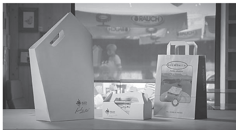
Βιοδιασπώμενες συσκευασίες από πλαστικό και χαρτί.

Για την υλοποίηση του προγράμματος επιλέχθηκε η συγκεκριμένη περιοχή της Ευρώπης, διότι διαθέτει μεγάλη τεχνογνωσία και παραγωγή , αλλά δεν χρησιμοποιεί πολλά βιώσιμα προϊόντα και έχει μείνει πίσω στον τομέα αυτό σε σχέση με την Δυτική Ευρώ-