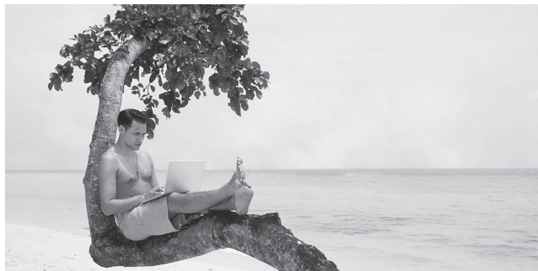
...Ψηφιακός νομάς που επέλεξε τόπο εργασίας δίπλα στη θάλασσα!

«...Οι καιροί αλλάζουν...» αγαπητοί μας αναγνώστες, με όλη τη σημασία της φράσης και σε πολλούς τομείς! Ο ... βιασμός του φυσικού μας περιβάλλοντος και η κλιματική αλλαγή ...συνεχίζουν να είναι εδώ και όσο γρηγορότερα εφαρμόσουμε μέτρα αντιμετώπισής τους, τόσο το καλύτερο για όλους μας, μπας και σώσουμε...οτιδήποτε αν σώζεται! Αλλιώς, οι πανδημίες , τα ακραία καιρικά φαινόμενα και οι ποικίλες συνέπειές τους θα μας επηρεάζουν ισχυρά και θα μας συντροφεύουν όλο