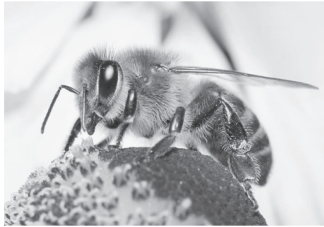
Σε 60 μόλις λεπτά το δηλητήριο των μελισσών τρυπάει τη μεμβράνη καρκινικών κυττάρων!

Συγκεκριμένα, ερευνητές από το Ινστιτούτο Ιατρικής Έρευνας Harry Perkins και το Πανεπιστήμιο της Δυτικής Αυστραλίας μελέτησαν την επίδραση του δηλητηρίου 312 μελισσών και βομβίνων από την Αυστραλία και την Ευρώπη σε διαφορετικές μορφές καρκίνου του μαστού . Έτσι, παρατήρησαν ότι