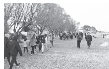
2η πεζοπορία Καστελόκαμπος 19-3-2017