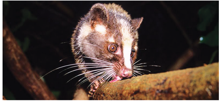
Το ζωάκι της φωτογραφίας, ένα είδος μοσχογαλής, θεωρείται πηγή του ιού του SARS, το 2002.

Είναι ήδη γνωστό ότι η κινεζική κυβέρνηση έχει προσωρινά αναστείλει την εμπορία προϊόντων από άγρια ζώα , που χρησιμοποιούνται συνήθως για φαγητό, ένδυση και παραδοσιακά φάρμακα. Το καλό νέο είναι ότι η μόνιμη επιτροπή της Εθνοσυνέλευσης έχει στην άμεση ατζέντα της νέες μακροχρόνιες ρυθμίσεις όσον αφορά στα προϊόντα που προέρχονται από άγρια ζώα, που μπορεί να φτάσουν και ως τη συνολική αναθεώρη-