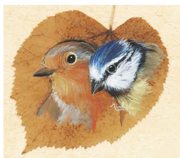
Ζωγραφισμένη η επιφάνεια του φύλλου

http://alitampouras.blogspot.com/2012/05/blog-post_7052.html