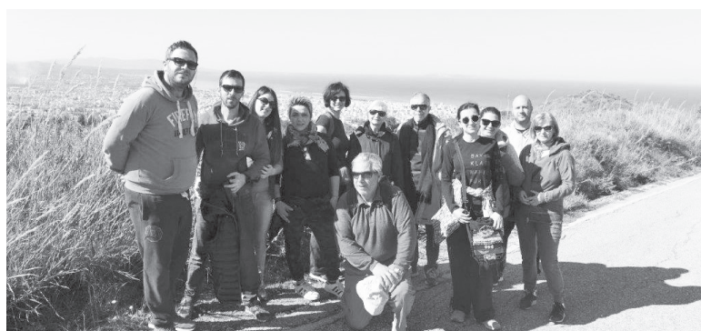
1η πεζοπορία Αρόη 12-3-2017

Τα οφέλη της πεζοπορίας είναι πολλά και ποικίλα. Είναι το καλύτερο ηρεμιστικό της ψυχής μας και