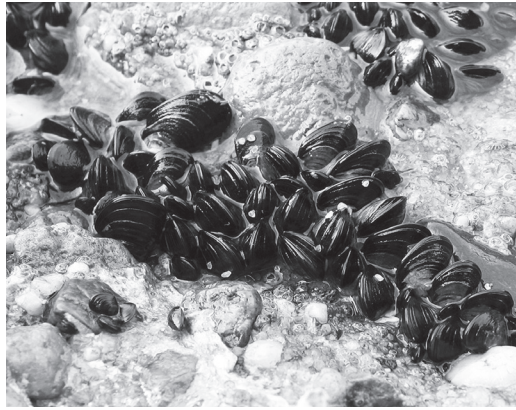
Μύδια κολλημένα στους βράχους.

Συγκεκριμένα, παρασκεύασαν συνθετικές κατεχόλες , που μιμούνται τις υγρές αλλά σταθερές κολλώδεις πρωτεΐνες, που εκκρίνονται από τα μύδια, και ανέπτυξαν μια νέα μέθοδο, που χρησιμοποιεί ηλεκτρικό ρεύμα , για να απενεργοποιήσει, σε επτά μόνο δευτερόλεπτα , την «κόλληση» ενός υλικού που περιέχει κατεχόλες. Η τεχνολογία αυτή, εκτός από την