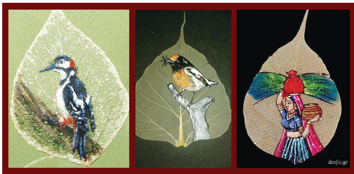
Ζωγραφική πάνω στο δίκτυο των νεύρων του φύλλου