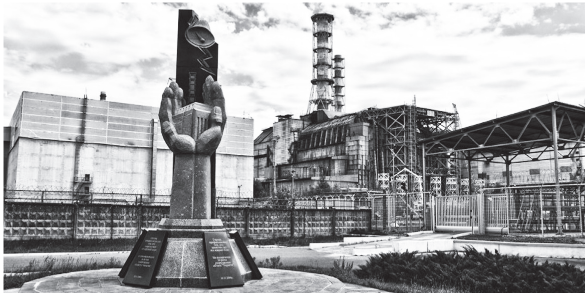
Μνημείο για τα θύματα στο Τσερνόμπιλ

«Δύσκολος» ο κορονοϊός και η εν γένει «συμπεριφορά» του προβληματίζει πολύ τους ερευνητές της υγείας, αλλά δεν είναι ο μόνος μικροοργανισμός που μας εκπλήσσει! Για παράδειγμα, στα ερείπια του παλιού πυρηνικού εργοστασίου στο Τσερνόμπιλ – εκεί που οι αντιδραστήρες συνεχίζουν να απελευθερώνουν ραδιε-