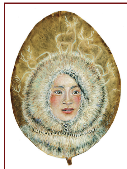
Έργο της Όλγας Κοτσιρέα