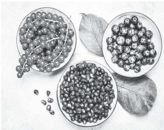
Η υψηλότερη αντιοξειδωτική ικανότητα βρέθηκε σε τζιτζιφα(!), βύσσινο, ρόδι, λωτούς και κεράσια.

Τα τελευταία χρόνια έχουν γίνει πολλές ερευνητικές εργασίες, που αποδεικνύουν ότι νέο-εισαγόμενα και πολυ-διαφημισμένα, ...τάχα μου, super foods , π.χ. ιπποφαές και γκότζι μπέρι έχουν παρόμοια ή μικρότερη συγκέντρωση αντιοξειδωτικών σε σύγκριση με