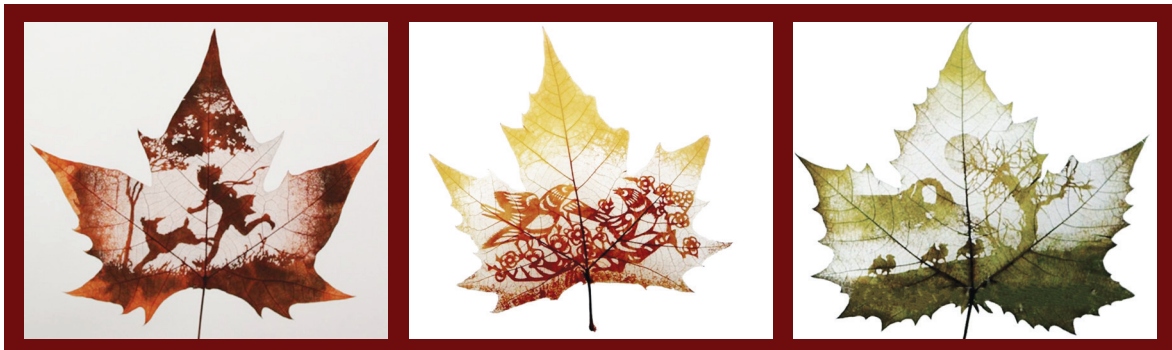
Τεχνική με αφαίρεση τμημάτων της μεμβράνης