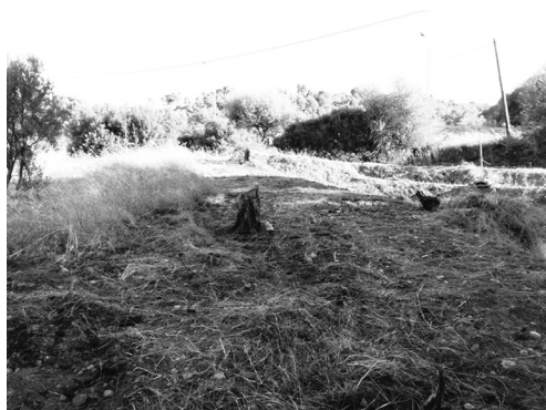
Εμφανείς οι παρεμβάσεις στο χώρο