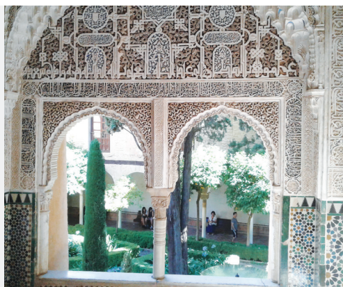
Αλάμπρα: απλά μοναδική

Στην Κόρντοβα την παλιά και τη νέα, ένα ζωντανό μουσείο, και τον Γουαδαλκιβίρ στην άκρη της να κυλά, για να κινήσει το πότισμα