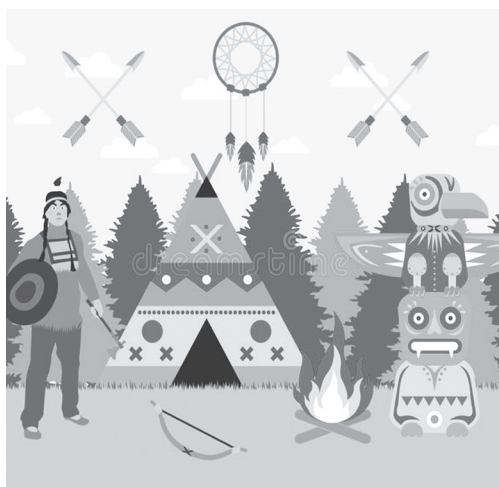
Οι αυτόχθονες διαθέτουν πρακτικές και γνώση διαχείρισης των πυρκαγιών.

Όσο για τις δασικές πυρκαγιές , οι σχετικοί ερευνητές (από το Ίδρυμα Prisma ) υποστηρίζουν πλέον ότι οι χώρες που κινδυνεύουν περισσότερο από αυτές πρέπει να υιοθετήσουν αρχέγονες πρακτικές , τις οποίες εφαρμόζαν ανέκαθεν οι αυτόχθονες , που διαχειρίζονται 9.000 εκατομ. στρέμματα δάσους σε όλον τον κόσμο!