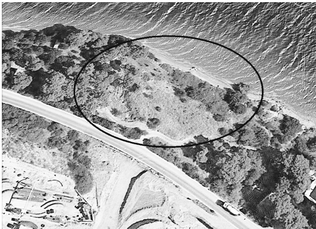
Αεροφωτογραφία με την καταπατημένη έκταση

Φυσικά, μετά από ανακρίσεις, οι υπάλληλοι απαλλάχθηκαν με την υπ. αριθμ. 259/2014 Διάταξη του Εισαγγελέα Πρωτοδικών Πατρών, χωρίς ποτέ η υπόθεση να φτάσει στο ακροατήριο.