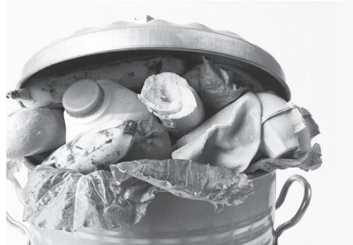
Αυξάνονται διαρκώς τα τρόφιμα που πετάμε!

Οι αλλαγές που προτείνονται, για να αλλάξει (γρήγορα) η κατάσταση, περιλαμβάνουν ενημέρωση των καταναλωτών , ώστε να αποκτήσουν μεγαλύτερη επίγνωση επί του θέματος, αυστηρό-