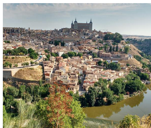
Τολέδο: μια πόλη ζωγραφιά

Συνεχίζουμε για την Σεβίλλη (700.000 κάτοικοι), όπου και διανυκτερεύουμε. Καλλιτεχνική, πολιτική και οικονομική πρωτεύουσα της Ανδαλουσίας χτισμένη στην ανατολική όχθη του ποταμού Γουαλδακιβίρ. Το βράδυ παρακολουθήσαμε μια βραδιά φλαμένγκο σε τσιγγάνικο σπίτι με γνήσιους χορευτές και μουσικούς. Θα μου μείνει αξέχαστο το βλέμμα της χορεύτριας, που κοίταζε αλλά δεν έβλεπε ακούγοντας μόνο τη φωνή και την κιθάρα του κιθαρίστα. Μια απίστευτη επικοινωνία-μυσταγωγία.