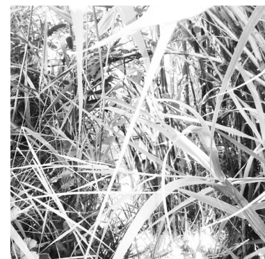
Μέσα από τα καλάμια διακρίνεται το ξύλινο κτίσμα

Σε πρόσφατη επίσκεψή μας με έκπληξη διαπιστώσαμε πως την παλιά ξύλινη κατασκευή, την οποία επίσης είχαμε καταγγείλει ως αυθαίρετο κτίσμα και είχε πράγματι επιβεβαιωθεί αυτό από τις αρμόδιες υπηρεσίες, έχει διαδεχτεί πέτρινο κτίσμα 30-40 περίπου τ.μ., το οποίο και κατοικείται από ένα πρόσωπο (από όσο μπορούμε να γνωρίζουμε) μέσα σε αύλειο χώρο περίπου 40 τ.μ. εκχερσωμένης έκτασης, που περιλαμβάνει άλλες δύο παλαιότερες ξύλινες κατασκευές ως βοηθητικούς χώρους, που πιθανόν ο ένας αποτελούσε την παλαιότερη γνωστή αυθαίρετη κατοικία. Η ανο-