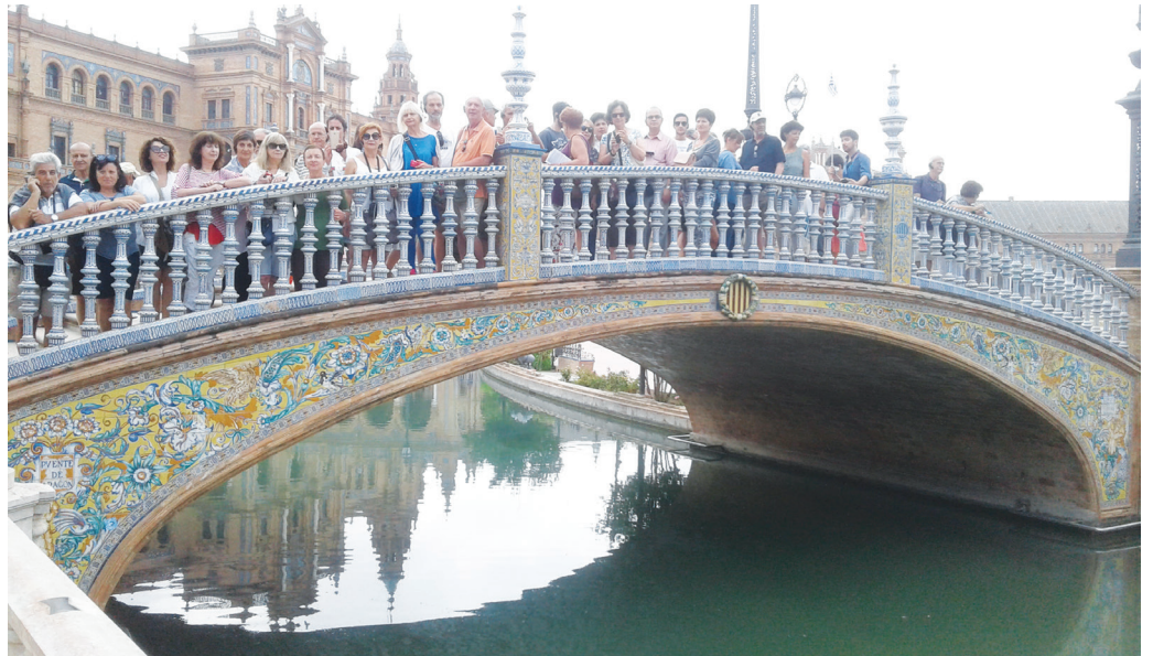
Πλάθα δε Εσπάνια στο πάρκο Μαρία Λουΐσα της Σεβίλλης

Καθώς το ταξίδι μας στη χώρα της Ιβηρικής φτάνει στο τέλος του, μια πολύ γνωστή και δεύτερη μεγαλύτερη πόλη της Ανδαλουσίας μάς περιμένει. Η Γρανάδα είναι χτισμένη πάνω σε τρεις λόφους και στη συμβολή δύο ποταμών. Η πολύ πρωινή ξενάγησή μας στην μαυριτανική