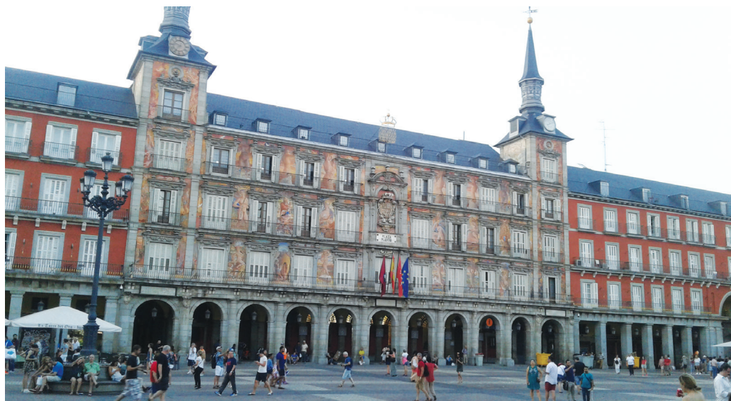
Πλάθα Μαγιόρ στη Μαδρίτη