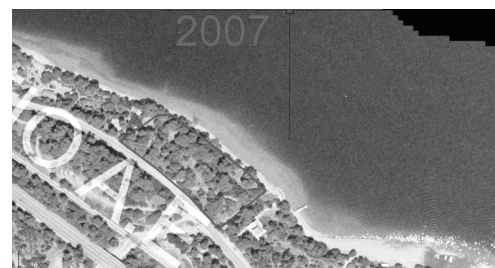
Χάρτης της περιοχής το 2007