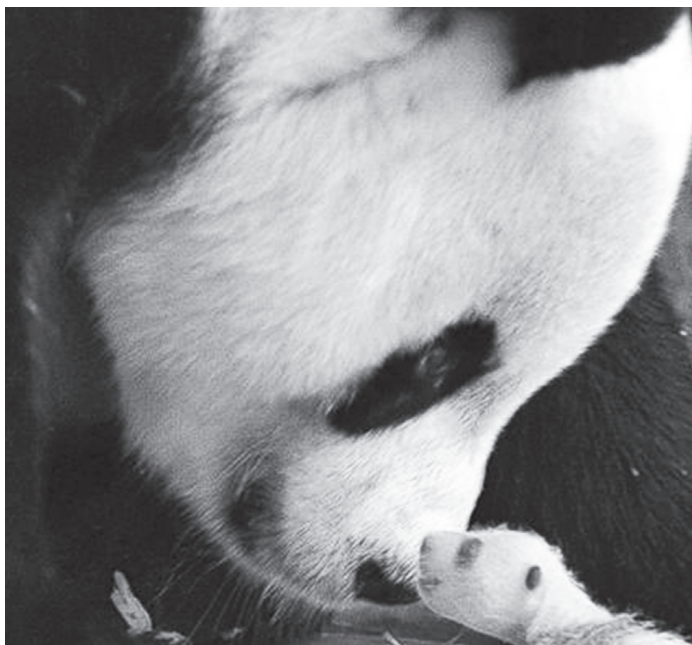
Η Τσάο Τσάο με ένα από τα μωρά της!

Τελικά, όπως ανακοίνωσε το κινεζικό κέντρο έρευνας για τα γιγάντια πάντα, στα τέλη του Ιουλίου η Τσάο Τσάο γέννησε το πρώτο ζευγάρι διδύμων γιγάντιων πάντα , που γεννιούνται από ένα γονιό να ζει στην άγρια φύση και τον άλλο σε συνθήκες αιχμαλωσίας! Πρόκειται