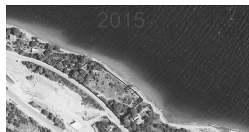
Χάρτης της περιοχής το 2015

Σε μηνυτήρια αναφορά, που υποβλήθηκε από τη δασική υπηρεσία το έτος 2011 σε βάρος του δικηγόρου, του εντολέα του και του χειριστή του μηχανήματος για επεμβάσεις στο αναδασωτέο πευκοδάσος και εκδικάστηκε στο Τριμελές Εφετείο Πατρών (αριθμ. 576/2015), κρίθηκαν ένοχοι. Άσκησαν έφεση και με την 143-144/2018 απόφαση πενταμελούς Εφετείου Πατρών αθώωθηκαν κατά πλειοψηφία. (Η αθώωση αφορούσε στη συγκεκριμένη επέμβαση στο πευκοδάσος, το οποίο, φυσικά, ΠΑΡΑΜΕΝΕΙ ΔΗΜΟΣΙΑ ΔΑΣΙΚΗ ΕΚΤΑΣΗ.)