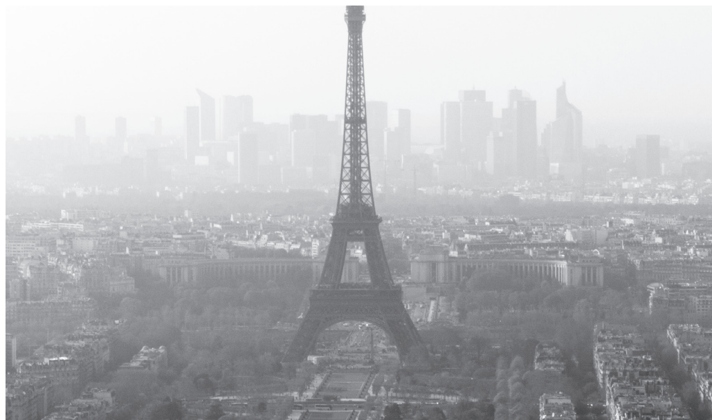
Ο Πύργος του Άιφελ εν μέσω ...νέφους

Επίσης, ας σημειωθεί ότι η ρύπανση, που οφείλεται κυρίως στα αυτοκίνητα (ακόμα και τα ντιζελοκίνητα!), μπορεί να είναι πολύ χειρότερη από αυτήν που δηλώνεται, επειδή οι Αρχές συνήθως τοποθετούν τους σταθ-