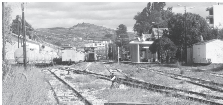
Σιδηροδρομικός σταθμός Πύργου: ως τότε χορταριασμένος;

Τρίτον, διότι γρήγορα ξαναβάζει την Ηλεία στο χάρτη της σιδηροδρομικής συγκοινωνίας, με