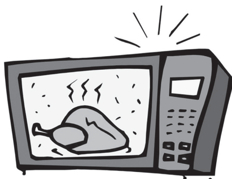
Οι φούρνοι μικροκυμάτων στην Ε.Ε., εκπέμπουν CO 2 όσο 7 εκατομ. αυτοκίνητα

Συγκεκριμένα, οι τουλάχιστον 130 εκατομ. φούρνοι μικροκυμάτων που υπάρχουν στην Ε.Ε. σήμερα, καταναλώνουν κάθε χρόνο περίπου 9,4 τεραβάτ ηλεκτρικού ρεύματος ανά ώρα, που ισοδυναμούν με την ηλεκτρική ενέργεια, η οποία παράγεται από τρία μεγάλα εργοστάσια ηλεκτροπαραγωγής! Επίσης, οι πωλήσεις φούρνων μικροκυμάτων συνεχώς αυξάνονται και ο αριθμός τους αναμένεται να φθάσει τα 135 εκατομμύρια το 2020, ενώ έως το 2025 τα στερεά απόβλητά τους θα έχουν φθάσει τις 185.000 τόνοους (περίπου 16 εκατομ. πεταμένες συσκευές)!