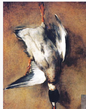
Jean-Baptiste-Siméon Chardin, 18ος αἰ., πουλιά θηράματα

http://stratisparelis.blogspot.gr/2014/04/blog-post_29.html