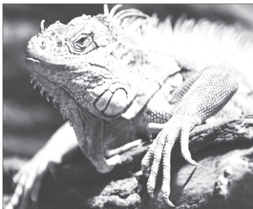
Ιγκουάνα στον ήλιο!

Ιδιαίτερα στις ΗΠΑ , (όπου ο κ. πρόεδρος αρνείται ...πεισματικά την ύπαρξη Κλιματικής Αλλαγής ), στις αρχές του Γενάρη ενέσκηψε πολικό ψύχος με