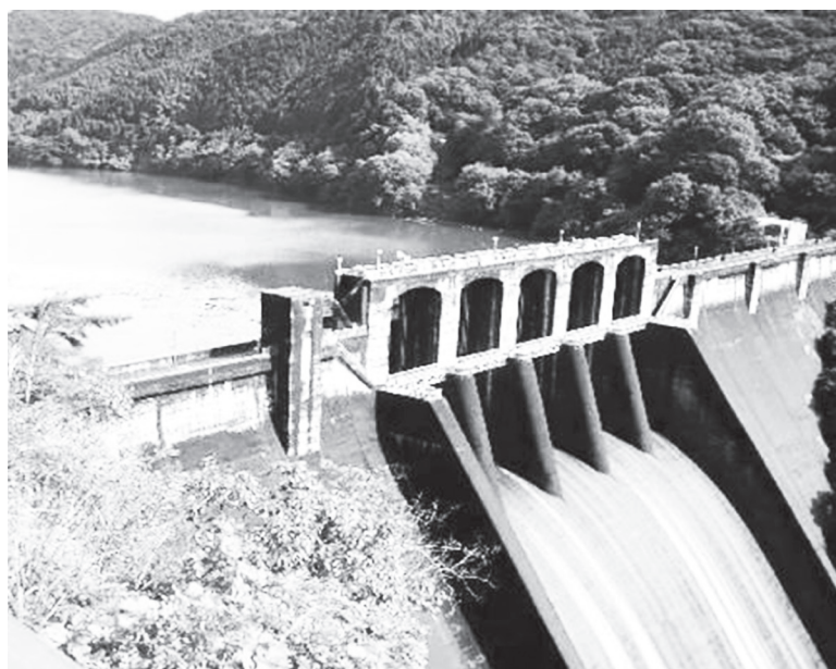
Υδροηλεκτρικό φράγμα στον Αμαζόνιο

Έως τώρα στον Αμαζόνιο και στους παραποτάμους του έχουν κατασκευαστεί ή βρίσκονται υπό κατασκευή 140 φράγματα (από τη Βραζιλία, το Πε-