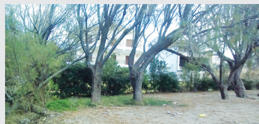
Οτι έχει απομείνει από τη συστάδα αλμυρικών που υπήρχαν καθ' όλο το μήκος της παραλίας «Δάφνες» μέχρι τον ποταμό Χάραδρο.