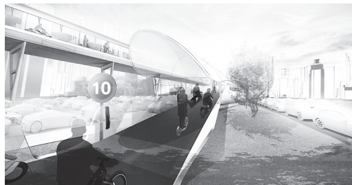
Σχέδιο υπερυψωμένου δρόμου για ηλεκτρικά δίτροχα στη Σαγκάη

Στόχος των επιστημόνων είναι να δημιουργήσουν ένα υπερυψωμένο δρόμο καταρχήν για ηλεκτρικά δίτροχα, το οποίο να εξασφαλίζει ταχύτερες και ασφαλέστερες καθημερινές μετακινήσεις αλλά και λιγότερα καυσαέ-