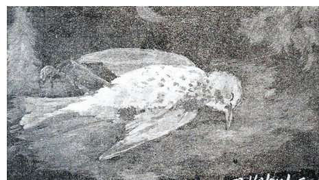
Σκοτωμένο σπουργίτι, Παναγιώτης Χαλούλος, 1972

http://users.uoa.gr/~nektar/arts/poetry/paylos_nirbanas_poems.htm