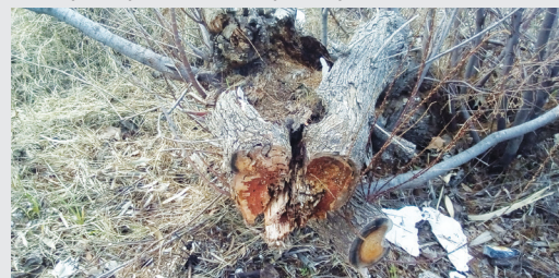
Κοπή κορμών αλμυρικών και αφαίρεση ξυλείας τους

σεων και εμπειρίας, να συνδράμει το σύλλογο «Η ΔΡΑΣΗ» καθ' οιονδήποτε τρόπο για την αποτροπή αυτού του φαινομένου.