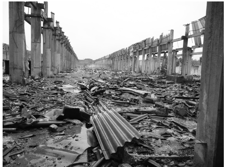
Φωτογραφία κτηρίου στην ΑΜΙΑΝΤΙΤ στις 28-04-2014

Η πρότασή μας προς τις αρμόδιες αρχές (Αποκεντρωμένη Διοίκηση, κυρίως, αλλά και Περιφέρεια και Δήμος Πατρέων) αφενός και την πλευρά των ιδιοκτητών αφετέρου είναι συνεννόηση στη βάση του διαχωρισμού των αποβλήτων σε πράγματι επικίνδυνα (σπασμένα φύλλα αμιαντοτσιμέντου, σάκουσ είτε έχουν ίνες είτε όχι και άλλα ανάλογα) από τη μια και τις μεγάλες ποσότητες των ρυπασμένων χρωμάτων από την άλλη. Τα πρώτα μπορούν με λογικό κόστος να μεταφερθούν στο εξωτερικό. Για τα δεύτερα, μπορεί να γίνει και νέος έλεγχος για την πραγματική τους επικινδυνότητα σήμερα και, εφόσον αυτός δείξει ότι μπορούν να ταφούν, πρέπει να ταφούν υγειονομικά σε τμήμα του χώρου, με ειδική