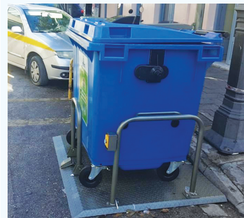
Ο «έξυπνος κάδος» έξω από το πρωτόκολλο του Δήμου στη Μαιζώνος

Πιλοτικό πρόγραμμα κάδων ανακύκλωσης, που λειτουργούν με ηλιακή ενέργεια, προωθείται στην πόλη, από την εταιρία που διαχειρίζεται το σύστημα με τους μπλε κάδους.