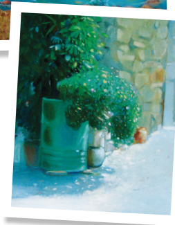
Jędrzejak Wiktor, Φυτά σε γλάστρες στα Μεστά Χίου

«Πέρα από το πανταχού παρόν, λευκό και γαλάζιο, αναφέρει η πρέσβης Άννα Μπαρμπάζακ, η Ελλάδα έχει και άλλα, διαφορετικά πρόσωπα – άλλο στο βόρειο τμήμα της χώρας, άλλο στις κεντρικές χερσαίες περιοχές και ακόμα άλλο στα νησιά. Τα έργα των Πολωνών καλλιτεχνών παρουσιάζουν επίσης την εικόνα της καθημερινής Ελλάδας, της πραγματικότητας που αλλάζει επηρεασμένη από τον χρόνο και διάφορα γεγονότα, τα οποία αποτελούν κοινές εμπειρίες των δυο λαών».