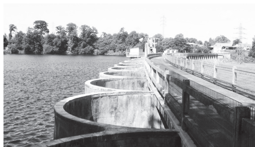
Το φράγμα του ποταμού Σελίν στη Γαλλία, που θα κατεδαφισθεί

Διάφορες περιβαλλοντικές ομάδες, συμπεριλαμβανομένης της WWF , έχουν επιδοκιμάσει την απόφαση, καθώς τα δύο φράγματα εμποδίζουν τη μετα-