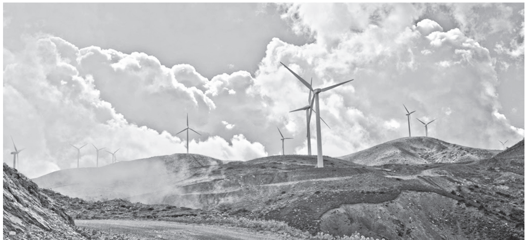
Το αιολικό πάρκο στο Παναχαϊκό

Ιδιαίτερα ευνοημένοι είναι οι κάτοικοι μι-