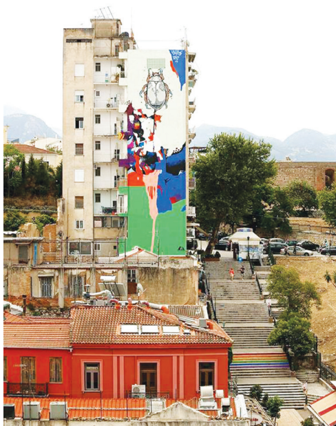
«Μεταμόρφωση τοίχου στη Γεροκωστοπούλου, στα πλαίσια του «ArtWalk 2»

Παρόλη τη μεγάλη συνεισφορά τους στον πολιτισμό της πόλης, όπως οι ίδιοι τονίζουν, δέχονται την άρνηση της Δημοτικής Αρχής για