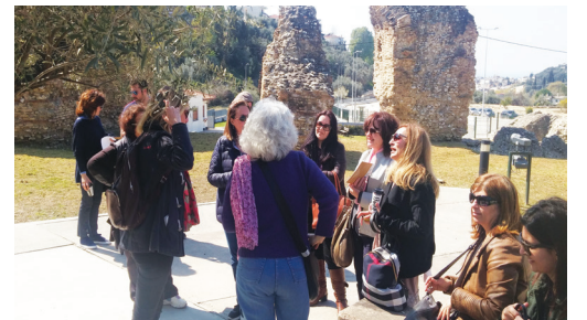
Θεματική ξενάγηση και περιβαλλοντική διαδρομή Εκπαιδευτικών στα πλαίσια ΣΕΜΙΝΑΡΙΟΥ στο χώρο του Ρωμαϊκού Υδραγωγείου Πάτρας (18/3/2017)

Η λειτουργία ενός τέτοιου Κέντρου (Κ.Ε.Α), υποστελεχωμένου με 5 εκπαιδευτικούς, σε μεγάλη απόσταση (113 χλμ σε ορεινή απομονωμένη περιοχή) από τη λειτουργία του κύριου όγκου των Σχολείων της Αχαΐας και σε απόσταση 2 ωρών από τους κύριους φορείς συνεργασίας (διοικητικές δομές, τοπική αυτοδιοίκηση, πανεπιστήμιο, ερευνητικά κέντρα, ΜΚΟ, κ.ά.) και τα κέντρα λήψης αποφάσεων στην Πάτρα, παρά τις υποσχέσεις για αναβάθμιση, μόνο συρρίκνωση και υποβάθμιση του θεσμού της Περιβαλλοντικής μπορεί να επιφέρει. Το πρόβλημα αντιμετωπίζει όχι μόνο η Αχαΐα, αλλά το 55% των νομών πανελλαδικά.