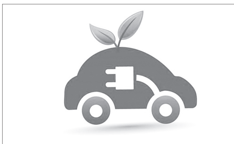
Το ηλεκτρικό αυτοκίνητο είναι φιλικό προς το περιβάλλον

Αξίζει να σημειωθεί, επίσης, ότι τα ηλεκτρονικά απόβλητα είναι η ταχύτερα αναπτυσσόμενη κατηγορία