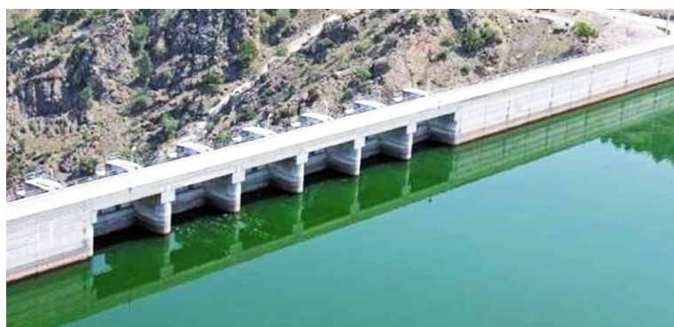
Το φράγμα Πείρου - Παραπείρου

Η γενική εικόνα των Υδάτων της ευρύτερης Δυτικής γεωγραφίας της χώρας παρουσιάζεται ικανοποιητική. Υπάρχουν όμως προβλήματα νιτρορύπανσης , με κυριότερη περιοχή τη Δυτική Αχαΐα, υφαλμύρωσης παράκτιων υπόγειων υδροφορέων, αλλά και για κάποια ποτάμια σε κάτω του επιπέδου της «καλής» κατάστασης ή ακόμη και με «κακή» κατάσταση. Πρόκειται για