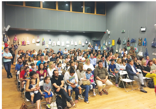
«Κάνε κάτι ΔΡΑΣΤΙΚΟ... Κόψε πια το ΠΛΑΣΤΙΚΟ!!!». Εκδήλωση Βράβευσης του διαγωνισμού κατασκευής ΠΙΑΝΙΝΗΣ ΤΣΑΝΤΑΣ, που δημιούργησαν οι μαθητές/τριες των περιβαλλοντικών ομάδων (25/5/2017)

Ο νομός Αχαΐας αναδεικνύεται πρωτοπόρος και βρίσκεται στην κορυφή των καινοτόμων δράσεων. Μόνο τη σχολική χρονιά 2016-17 υλοποιήθηκαν 440 προγράμματα Περιβαλλοντικής