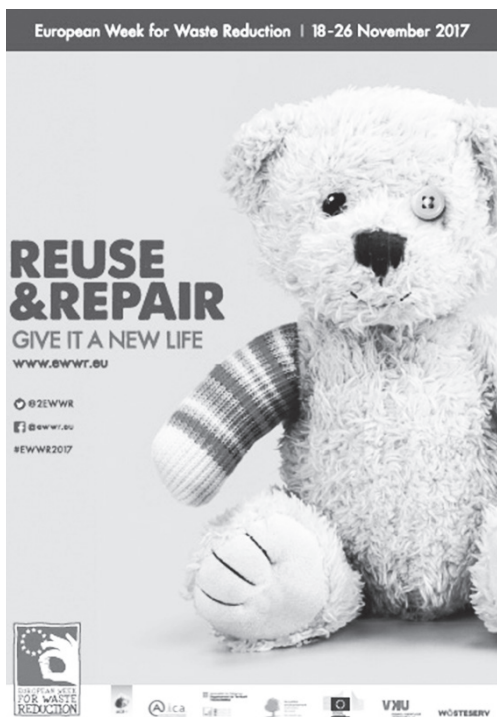
Πετυχημένη αφίσα για την Ευρωπαϊκή Εβδομάδα Μείωσης Αποβλήτων

Από 18 έως 26 Νοεμβρίου γιορτάστηκε πάλι η Ευρωπαϊκή Εβδομάδα Μείωσης Αποβλήτων , που είναι η μεγαλύτερη ευρωπαϊκή καμπάνια του είδους και όπου συμμετείχαν πολλές ευρωπαϊκές πόλεις. Κύριο σύνθημα « Το καλύτερο απόβλητο