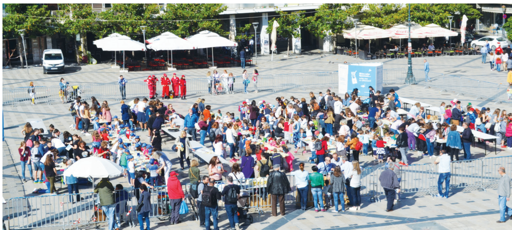
Δράση προβολής των Περιβαλλοντικών Προγραμμάτων στην Πλ. Γεωργίου Α' στην Πάτρα, με στόχο την ευαισθητοποίηση των πολιτών για την κατάργηση της πλαστικής σακούλας (18/5/2017)

Να επιβάλει ασφυκτικό πολιτικό - διοικητικό έλεγχο στα νέα Κέντρα Εκπαίδευσης για την Αειφο-