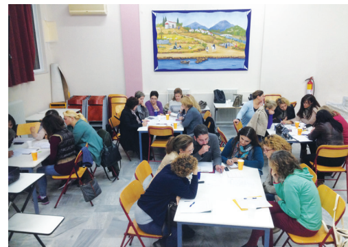
Εισαγωγικό σεμινάριο Περιβαλλοντικής Εκπαίδευσης (2016)

Επιχειρούνται αλλαγές που υποβαθμίζουν το έργο και τα λαμπρά αποτελέσματα που έχουν να επιδείξουν οι εκπαιδευτικοί, που εθελοντικά υλοποιούν Προγράμματα Περιβαλλοντικής Εκπαίδευσης, οι Υπεύθυνοι/ες Περιβαλλοντικής Εκπαίδευσης και τα Κέντρα Περιβαλλοντικής Εκπαίδευσης.