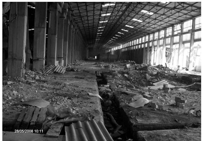
Φωτογραφία του ιδίου κτηρίου στις 28-05-2008

εφ' άπαξ άδεια προς την ιδιοκτησιακή πλευρά.