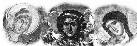
ΤΡΙΑ ΒΥΖΑΝΤΙΝΑ ΜΝΗΜΕΙΑ ΤΗΣ ΑΧΑΪΑΣ ΑΠΟΚΑΤΑΣΤΑΣΗ ΚΑΙ ΑΝΑΔΕΙΞΗ

Μία έκθεση, όπου ο επισκέπτης έχει την ευκαιρία να γνωρίσει από κοντά έργα των μεγάλων «δασκάλων» της εποχής αυτής που διαμόρφωσαν τα χαρακτηριστικά της γενιάς του '30, όπως του Λυκούργου Κογεβίνα (που θεωρείται από τους πρωτοπόρους Έλληνες στην χαλκογραφία), του Δημήτρη Γαλάνη (πρωτοπόρος χαρακτήρας, που έφερε σε επαφή την ελληνική τέχνη με τα ευρωπαϊκά ρεύματα και κινήματα, μέσα από τις πολύ γνωστές «Νεκρές Φύσεις» του), καθώς και του πολύ σημαντικού Γιάννη Κεφαλληνού, καθηγητή της Ανωτάτης Σχολής Καλών Τεχνών, από το εργαστήριο του οποίου ξεπετάγονται ο Α. Τάσσος, η Βάσω Κατράκη, ο Γιώργος Σικελιώτης και άλλοι.