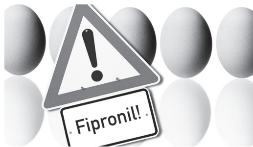
Αυγά μολυσμένα με φυτοφάρμακα στη Β. Ευρώπη

Οι έλεγχοι, όμως, συνεχίζονταν μέχρι το τέλος του Οκτώβρη για να ολοκληρωθούν σε συνολικά 800 δείγματα. Όπως φαίνεται, όμως, σε ποσοστό 20% των ελεγχθέντων μέχρι αρχές φθινοπώρου προϊόντων βρέθηκαν ίχνη της τοξικής ουσίας, ενώ σε ένα ανάμεσα στα τέσσερα πάνω από τα ανώτατα επιτρεπτά όρια. Ίχνη του εντομοκτόνου πάνω από το ανώτατο επίπεδο βρέθηκαν, επίσης, στις σαλάτες με αυγά, σε ζύμη και ζυμαρικά με βάση το