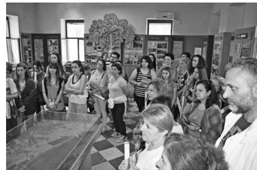
Ξενάγηση στο κέντρο πληροφόρησης του Φορέα Διαχείρισης Κοτυχίου Στροφυλιάς

Καλεί δε όλους τους εμπλεκόμενους, Πολιτεία, Περιφερειακή και Τοπική Αυτοδιο-