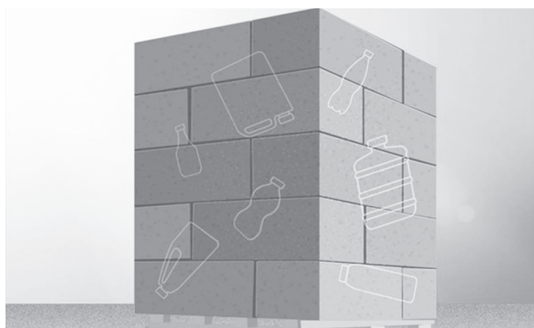
Ενισχυμένο το σκυρόδεμα με ανακυκλωμένα πλαστικά μπουκάλια στις ΗΠΑ

Αν και χαμηλό το ποσοστό της υποκατάστασης, θα έχει σημαντικό αντίκτυπο αν εφαρμοστεί σε παγκόσμια κλίμακα , διότι το σκυρόδεμα είναι το δεύτερο ευρύτερα χρησιμοποιούμενο υλικό στη Γη μετά το νερό! Επίσης, λαμβάνοντας υπόψη ότι περίπου