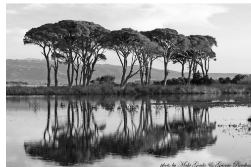
Κουκουναριές (Pinus pinea) Στροφυλιά

κτηση, Οικολογικό Κίνημα και Ενεργούς πολίτες, να στηρίξουν και να προστατεύσουν τις δομές αυτές, πολύτιμη παρακαταθήκη στο διαρκώς υποβαθμιζόμενο οικοσύστημα.