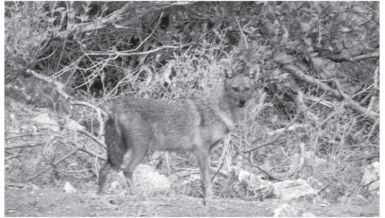
τσακάλι στο Εθν. Πάρκο Στροφιλιάς

άγριο τρόπο «σφαγή» των προβάτων παραπέμπει περισσότερο σε συμπεριφορά αγέλων αδέσποτων σκύλων, που έχουν περάσει σε άγρια κατάσταση παρά τσακαλιών και εκτιμούμε πολύ πιθανότερο να οφείλεται σε αυτά. Εν πάση δε περιπτώσει, διατάξεις για την αποζημίωση των κτηνοτρόφων στις περιπτώσεις τέτοιου είδους απώλειας ζώων υπάρχουν και μπορούν να αξιοποιηθούν από κάθε πληγέντα κτηνοτρόφο. Οι αρμόδιες δασικές υπηρεσίες μπορούν να βοηθήσουν, ώστε οι αποζημιώσεις να καταβληθούν γρήγορα και δίκαια και θα