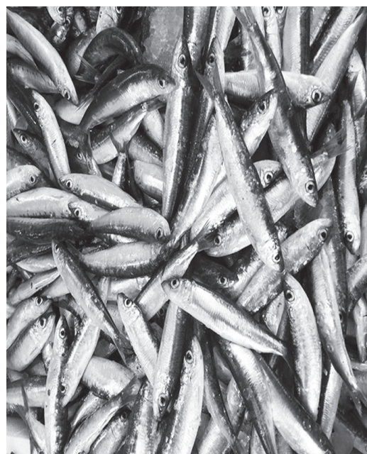
Γαύροι με μικροπλαστικά εντοπίστηκαν στην Ιαπωνία

Η ερευνητική ομάδα, του Πανεπιστημίου του Κιότο που διεξήγαγε την έρευνα από τον Οκτώβριο έως τον Δεκέμβριο του 2016 σε 197 είδη ψαριών από επτά είδη,, που αλιεύθηκαν σε έξι διαφορετικές περιοχές, βρήκε 140 μικροπλαστικά από 16 είδη πλαστικών σε 74 ψάρια ή 37,6%