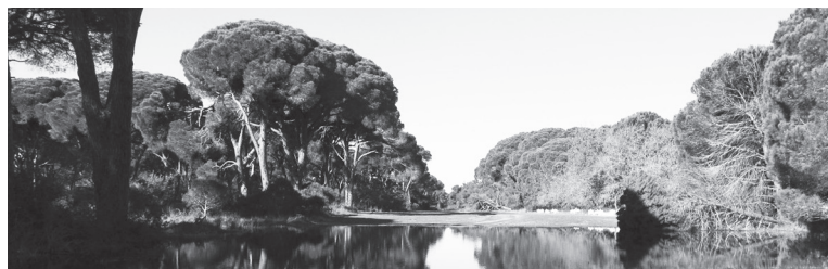
Υγροβιότοπος Κοτυχίου, Δάσος Στροφυλιάς

3. Διονύσιος Μαυρογιάννης , Περιφερειακός Σύμβουλος Περιφερειακής Ενότητας Αχαΐας, ως εκπρόσωπος της Περιφέρειας Δυτικής Ελλά-