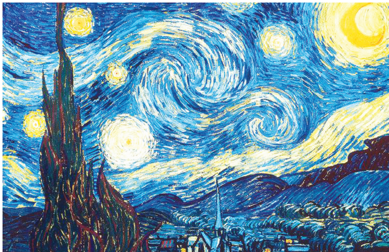
Εναστρη Νύχτα, 1889

Στο έργο Έναστρη Νύχτα ο Βαν Γκογκ έχει απεικονίσει χαοτικές δίνες, που από μαθηματική ανάλυση της εικόνας προέκυψαν εντυπωσιακά συμπεράσματα. Οι χαοτικές δίνες ακολουθούν με ακρίβεια τις μαθηματικές περιγραφές των αναταράξεων σε ρευστά υλικά, όπως οι στροβιλισμοί του νερού σε ένα ταραγμένο ρυάκι ή οι πραγματικοί ανεμοστρόβιλοι. Ο Βαν Γκογκ αναπαράγει σε αρκετούς πίνακές του, επακριβώς, νόμους της φύσης. Η ανάλυση των πινάκων του Βαν Γκογκ στον υπολογιστή αποκάλυψε ένα μοτίβο φωτεινών και σκοτεινών περιοχών που ακολουθούν τις εξισώσεις του Αντρέι Κολμογκόροφ, του Σοβιετικού επιστήμονα που τη δεκαετία του 1940 κατάφερε να περιγράψει, έστω και εν μέρει, τη δυναμική του στροβιλισμού των ρευστών. Οι ταραγμένοι ουρανοί στην Έναστρη Νύχτα και στο Δρόμος με Κυπαρίσσι και Άστρο , μεταξύ άλλων, παρουσιάζουν τη λεγόμενη «κλιμάκωση Κολμογκόροφ», εξισώσεις που δίνουν την πιθανότητα δύο οποιοδήποτε σημεία του ρευστού να έχουν μια δεδομένη διαφορά ταχύτητας.