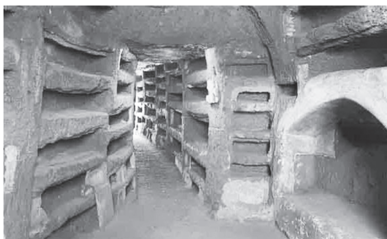
Οι κατακόμβες της Ρώμης

Συγκεκριμένα, υπολογίζεται ότι η Καμόρα, η μαφία της Νάπολης , κερδίζει ετησίως 20 δις ευρώ από αυτή την