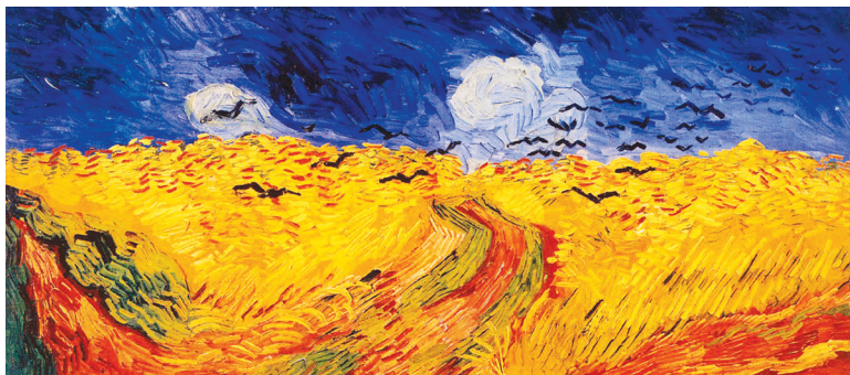
Σταροχώραφα με κοράκια, 1890

Ο Ολλανδός Vincent Van Gogh (Βαν Γκογκ) γύρω στο 1878 αρχίζει να ασχολείται με τη ζωγραφική. Στο Παρίσι θα συναντηθεί με τους ιμπεριονιστές. Θα επηρεαστεί από την τεχνοτροπία τους, θα αγαπήσει τα έντονα χρώματα και την τεχνική του καθαρού χρώματος κατευθείαν πάνω στην εικονιστική επιφάνεια, τη σύλληψη της στιγμιαίας εντύπωσης μιας φύσης που βρίσκεται σε διαρκή κίνηση και μεταβολή. Τα χαρακτηριστικά αυτά μπορούμε να διακρίνουμε στους πίνακες που επιλέξαμε στο παρόν άρθρο.