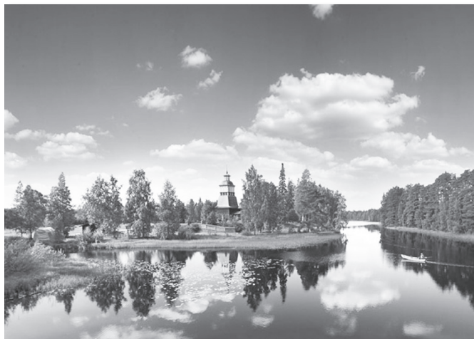
Φινλανδία, η χώρα των χιλίων λιμνών!

Αξίζει μάλιστα να αναφέρουμε με χαρά ότι φέτος καταγράφηκαν σε όλο τον κόσμο σημαντικές πρόοδοι στην