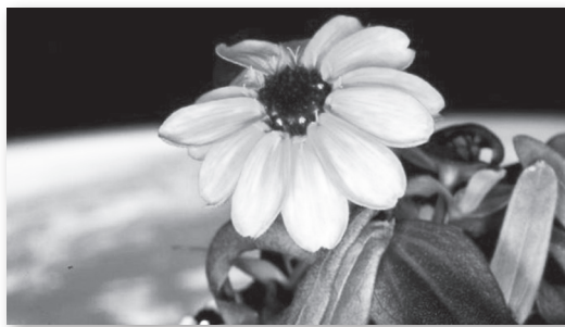
Η διαστημική ζίνια σε φωτο του επικεφαλής του ISS Σκοτ Κέλι

Βέβαια, οι « διαστημικοί κηπουροί » χάρηκαν τόσο, διότι θεωρούν ότι με την