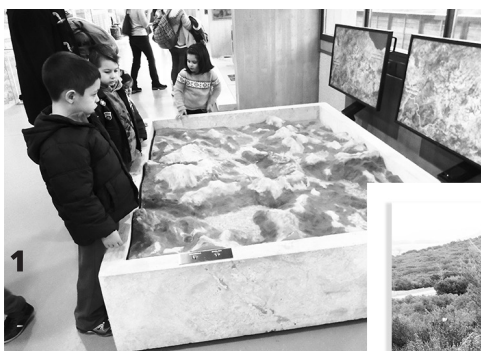
1. Μαθητές παρατηρούν αναπαράσταση του ανάγλυφου

Τέλος, να προσθέσουμε ότι το Μουσείο Περιβάλλοντος Στυμφαλίας οργανώνει εκπαιδευτικά προγράμματα, με παιχνίδια και δραστηριότητες , για σχολεία και ομαδικές επισκέψεις, όπως το πρόγραμμα «Παιχνίδια μυστικά, στην λίμνη τα νερά».