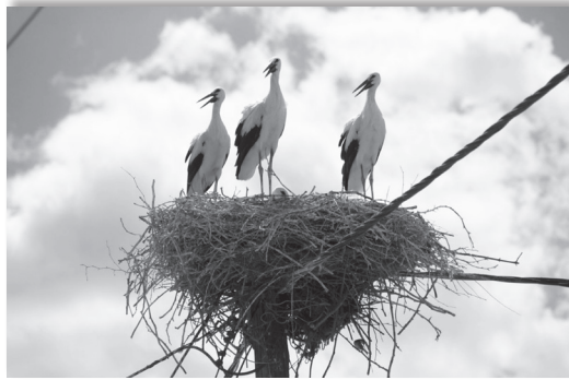
Πελαργοί σε φωλιά πάνω σε στύλο της ΔΕΗ!

Συγκεκριμένα, ερευνητές τοποθέτησαν δορυφορικούς πομπούς σε νεαρούς λευκοπελαργούς ( Ciconia ciconia ), που γεννήθηκαν σε οκτώ χώρες - Αρμενία, Ελλάδα, Πολωνία, Ρωσία, Γερμανία, Τυνησία και Ουζμπεκιστάν - και διαπίστωσαν ότι, ενώ οι περισσότεροι αποδήμησαν το χειμώνα για την Αφρική, υπήρξαν και πολλές ...εξαιρέσεις! Για παράδειγμα ορισμένα ενήλικα πουλιά διαχείμασαν στην Ισπανία ή ακόμα και στις σκανδιναβικές χώρες(!) , όπου οι άνθρωποι προσφέρουν άφθονη τροφή, ενώ πελαργοί από τη Γερμανία προτίμησαν να περάσουν το χειμώνα τρώγοντας σκουπίδια σε χωματερές του Μαρόκου!