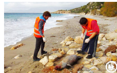
Η νεκρή φώκια στη Σάμο

Όλοι εμείς στο Ινστιτούτο Θαλάσσιας Προστασίας «Αρχιπέλαγος» αρνούμαστε να μένουμε με σταυρωμένα τα χέρια και να αναλάβουμε τον ρόλο του νεκροθάφτη, μετρώντας αντίστροφα μέχρι την πλήρη εξαφάνιση της μεσογειακής φώκιας. Για το συγκεκριμένο