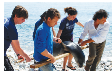
Θανατωμένη φώκια από έκρηξη δυναμίτη, ακριβώς στην ίδια περιοχή το 2010

περιστατικό πρόκειται να εξαντλήσουμε κάθε νόμιμο μέσο, για τον εντοπισμό αλλά και την κίνηση της ποινικής διαδικασίας εις βάρος αυτού που προκάλεσε την ηθελημένη θανάτωση της φώκιας με τη χρήση εκρηκτικών στη θάλασσα!