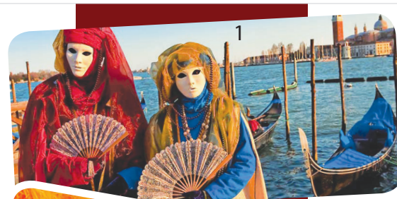
Βενετσιάνικες ...πόζες! (1,2)