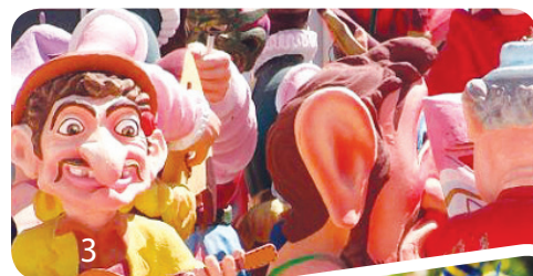
Πατρινοί καρναβαλιστές (3,4)