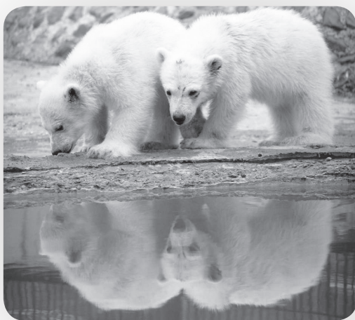
Πολικές αρκούδες σε ζωολογικό κήπο της Σιβηρίας

πίσω στην ατμόσφαιρα το καλοκαίρι, κάτι που μπορεί να διαταράξει την πολική δίνη και να τη φέρει νοτιό-