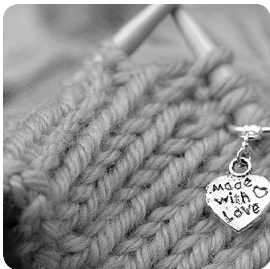
Πλέξτε και για τους άλλους ...με αγάπη

Επίσης, με το πλέξιμο μπορούμε να προστατεύσουμε το περιβάλλον επενδύοντας σε λίγα ποιοτικά ρούχα αντί να αγοράζουμε φθηνά προϊόντα μαζικής παραγωγής χωρίς διάρκεια, που ξεθωριάζουν και ξεχειλώνουν με το πέρασμα του χρόνου. Ταυτόχρονα, προσφέρει τη χαρά της ανεξαρτητοποίησης απέναντι στις εν πολλοίς ...αμαρτωλές αλυσίδες καταστημάτων ένδυσης και μας βοηθά να ενισχύσουμε την τοπική οικονομία , αγοράζοντας εγχώριο μαλλί από κατάστημα της γειτονιάς μας!