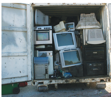
Ανακύκλωση συσκευών στην Πάτρα: Απαιτούνται μόνιμα σημεία συλλογής.

Δεν υπάρχει ακόμα στην Ελλάδα εργοστάσιο επεξεργασίας των λαμπτήρων. Έτσι, οι λαμπτήρες αποθηκεύονται προσωρινά, μέχρις ότου συγκεντρωθούν επαρκείς ποσότητες, οπότε και αποστέλλονται για επεξεργασία σε εξειδικευμένες μονάδες στο εξωτερικό. Τα φωτιστικά παραδίδονται σε δύο συμβεβλημένες εγχώριες μονάδες ανακύκλωσης.