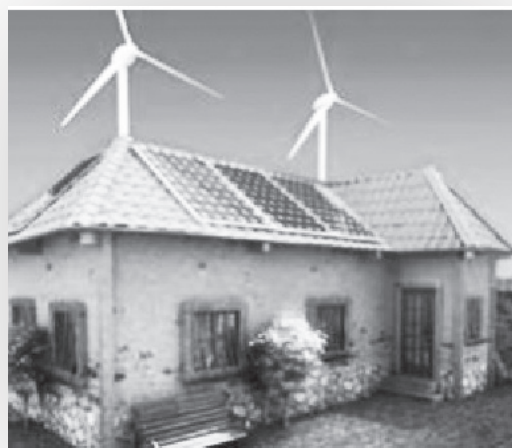
Αυτονομημένο ενεργειακά σπίτι με φωτοβολταϊκά πάνελ και ανεμογεννήτριες στη στέγη

Έτσι οι απανταχού αρχιτέκτονες και οικολόγοι συμφωνούν ότι ο αστικός σχεδιασμός, με τον τρόπο που διενεργείται σήμερα, αντιβαίνει στις προσπάθειες προστασίας του περιβάλλοντος και διατήρησης των φυσικών πόρων. Συνεπώς, τη στιγμή που τα γνωστά αποθέματα ορυκτών καυσίμων αναμένεται να έχουν εξαντληθεί σε λιγότερο από μισό αιώνα – πρόκειται για την ενέργεια που κινεί τα οχήματά μας και θερμαίνει τα σπίτια μας – φαίνεται ότι ένα από τα μεγάλα στοιχεία της κοινωνίας μας παραμένει η κατασκευή κατοικιών που θα ενσωματώνουν – συχνά απλές – τεχνολογίες καθαρής ενέργειας και εξοικονόμησης .