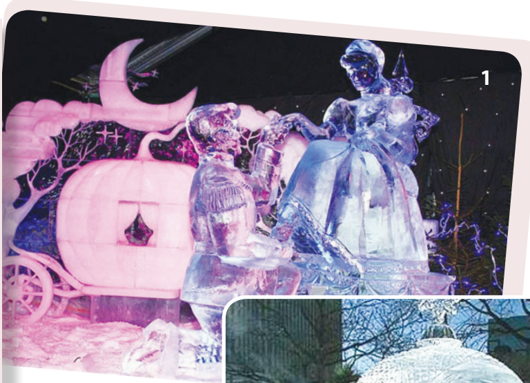
φωτογρ. 1: Σκηνές από γνωστά παραμύθια στην πόλη Μπριζ στο φεστιβάλ του 2012 φωτογρ. 2: Στη Μπριζ: η άμαξα της Χιονάτης!

Μαγευτικούς κόσμους δημιουργούν οι Βέλγοι στην πανέμορφη πόλη Μπριζ, στα πλαίσια των Χριστουγεννιάτικων εκδηλώσεων. Καλλιτέχνες από πολλές γωνίες του κόσμου συρρέουν στην πόλη για να σμιλέψουν πάνω από 250 τόνους πάγου δημιουργώντας μοναδικά αλλά εφήμερα έργα τέχνης.