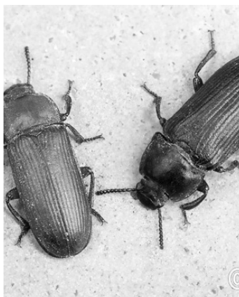
Σκαθάρια tenebrio-molitor , ίσως χρήσιμα για παραγωγή βιοπλαστικού

Το πρωτοποριακό υλικό που δημιουργεί κατ' αυτόν τον τρόπο είναι αδιάβροχο και ανθεκτικό στις υψηλές θερμοκρασίες και το ονομάζει « κολεόπτερα », όπως λέγονται και τα σκαθάρια απ' όπου προέρχεται. Όπως υποστηρίζει, με τη διεξαγωγή κατάλληλης έρευνας, η ιδέα της θα μπορούσε να χρησιμοποιηθεί για τη μεί-