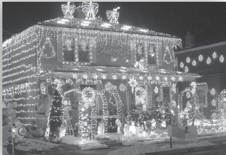
Παρα...φωταγωγήθηκαν και φέτος μερικά σπίτια στις γιορτές

επιβαρυνόμαστε με κάποια ευρώπουλα παραπάνω, όπως αποφάνθηκε και το αμερικανικό δίκτυο ABC News , που