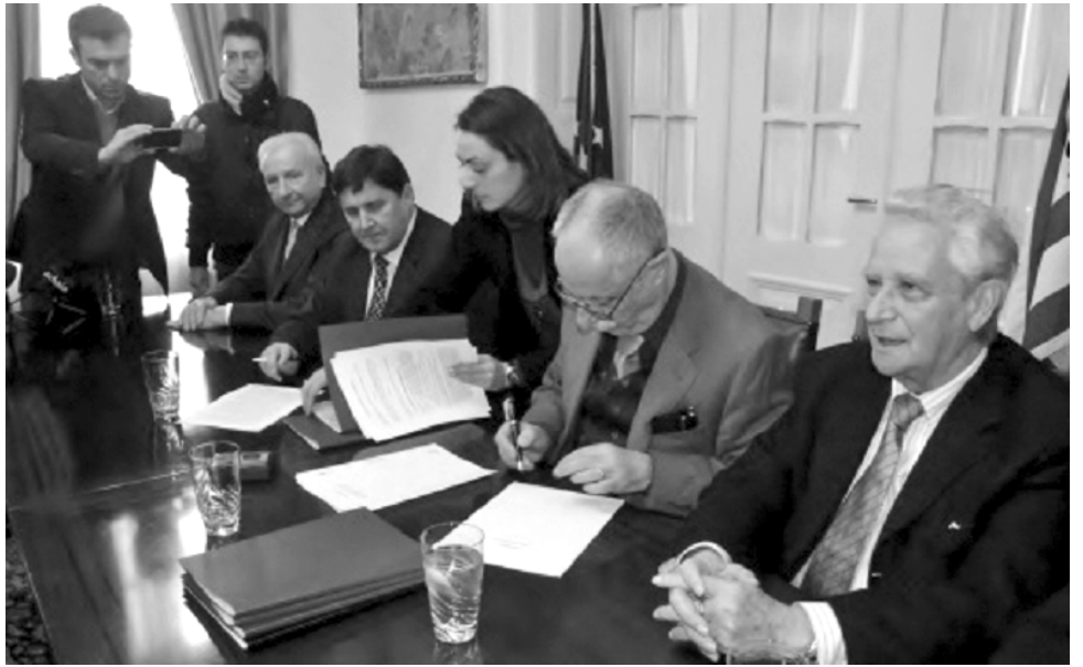
Η στιγμή της υπογραφής για την παραχώρηση του θαλάσσιου μετώπου

Η συμφωνία δεν επετεύχθει άμεσα δεν ήταν απλή, ούτε έγινε χωρίς μάχη. Η σύσταση της επιτροπής "Πρωτοβουλία ενεργών πολιτών" υπήρξε καθοριστική για την σημερινή επιτυχία. Οι συνεχείς διαβουλεύσεις, οχλή-