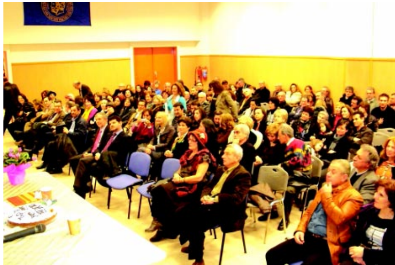
Κατάμεστη η αίθουσα του Παμπελοποννησιακού Σταδίου

* Συνεχίσαμε τις παρεμβάσεις μας για την προστασία της Στροφυλιάς όπου συμβάλαμε στην έκδοση θετικών δικαστικών αποφάσεων σχετικά τις καταπατημένες εκτάσεις στα Σαμαρέικα. Στον ίδιο χώρο αναδείξαμε και καταγγείλαμε παράνομες περι-