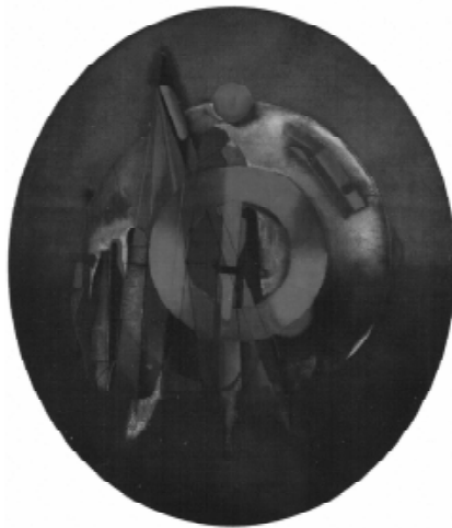
ΔΗΜΟΤΙΚΗ ΠΙΝΑΚΟΘΗΚΗ ΠΑΤΡΩΝ

"Στις αρχές τις δεκαετίας του 1920 ο Ιβάν Κλιούν ζωγράφισε μία σειρά έργων που ο ίδιος ονόμασε "κοσμικές εικόνες". Μία από αυτές τις "εικόνες" αποτελεί και η σύνθεση "Κόκκινο φως, σφαιρική κατασκευή". Στο συγκεκριμένο έργο αντανακλάται επίσης η γοητεία και η έλξη που ασκούσαν σε πολλούς Ρώσους καλλιτέχνες της πρωτοπορίας οι θεωρίες για κοσμικά, αστρονομικά φαινόμενα και το ενδιαφέρον τους για τη μελλοντική κατάκτηση του διαστήματος και τη μελέτη της φύσης του σύμπαντος."