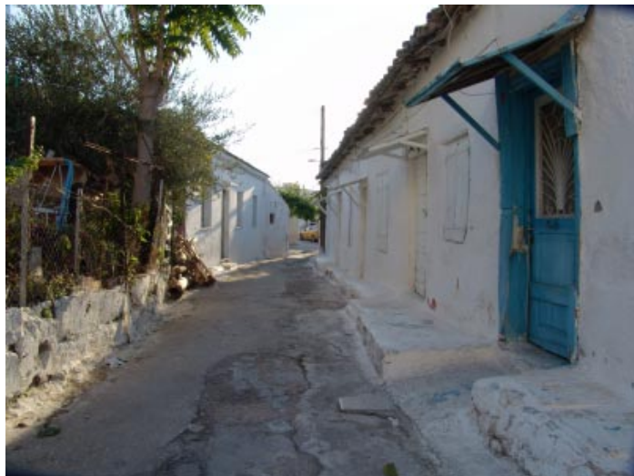
Στενό με λαϊκές συνοικίες στα "Γύφτικα"

Έχει γράψει άλλωστε ο Άρης Κωνσταντινίδης πριν από έξι δε-