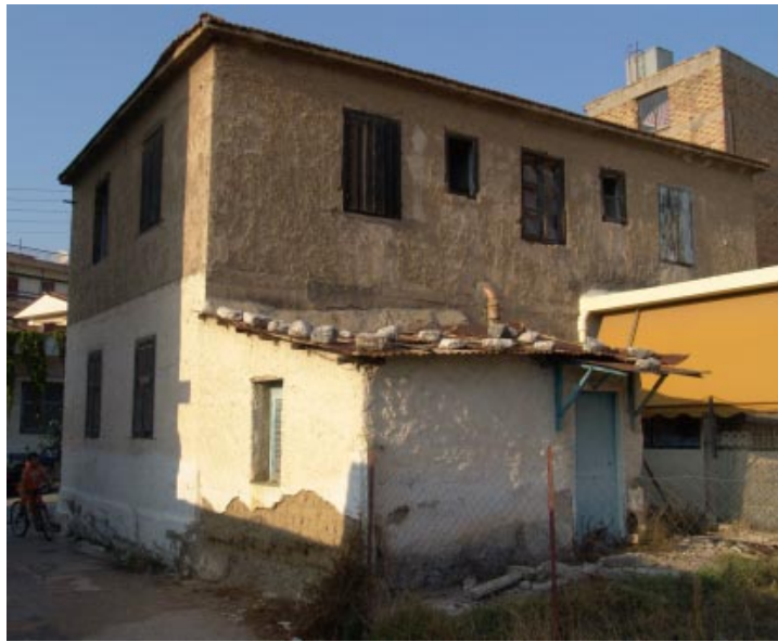
Τυπική προσφυγική κατοικίας με προσθήκες που εξυπηρετούσαν τις ανάγκες των ενοίκων της

Εκεί, στα κτίρια αυτά, έχει καταγραφεί το μεράκι και ο μόχθος του ανώνυμου τεχνίτη, το γέλιο και το κλάμα, η ανάσα και ο ιδρώτας όσων τα κατοίκησαν, στα σημάδια που άφησε το πέρασμα του χρό-