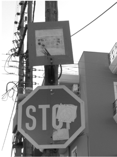
Ταμπέλα αστικού λεωφορείου με μπλε πλαίσιο, τοποθετημένη πάνω από ταμπέλα οδικής σήμανσης, στη γωνία των οδών Σκύρου και Αυλώνας. Την φωτογράφησαμε γιατί ΔΕΝ υπάρχει στάση σ' αυτό το σημείο

Ειδικά για την γραμμή 2 (ΤΕΙ-ΣΥΧΑΙΝΑ-ΤΕΙ) η Ομάδα Εργασίας μας προχώρησε και στην ποσοτική καταγραφή των παρατηρήσεων της. Καταγράψαμε την ύπαρξη ή μη έξι (6) βασικών υποδομών: στύλου ή στεγάστρου, παγκάκιου, κάδου απορριμμάτων, εκδοτηρίου ή εναλλακτικά σημείου πώλησης εισιτηρίων και τέλος πλατφόρμα /αναβατόριο για την προσβασιμότητα