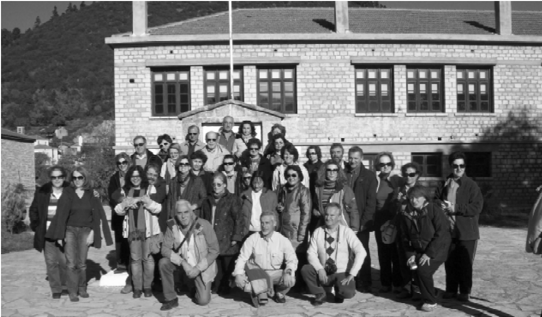
Η οικοπαρέα μας μπροστά από το ιστορικό Δημοτικό Σχολείο Κορυσχάδων

Το Σάββατο 5 και την Κυριακή 6 Νοεμβρίου πραγματοποιήσαμε με την ΟΙΚΟΠΑΡΕΑ μας μια ακόμα υπέροχη εκδρομή στην πανέμορφη Ευρυτανία. Ένας τόπος όπου δικαιοματικά έχει κερδίσει τον τίτλο: «Ελβετία της Ελλάδας» αφού το αλπικό τοπίο με τις επιβλητικές βουνοκορφές, τα φαράγγια, τα ποτάμια με τα κρυστάλλινα νερά τους και τα πολλά πέτρινα χωριουδάκια δίνουν στον τόπο χρώμα και άρωμα αυθεντικής υπαίθρου!