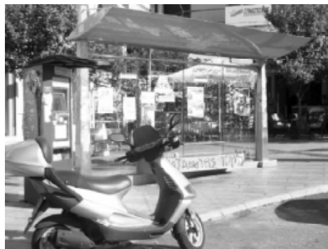
Στέγαστρο και εκδοτήριο στο πάνω μέρος της πλατείας Γεωργίου. Η σταση έχει μεταφερθεί σε άλλο σημείο και το αυτόματο εκδοτήριο δεν λειτουργεί