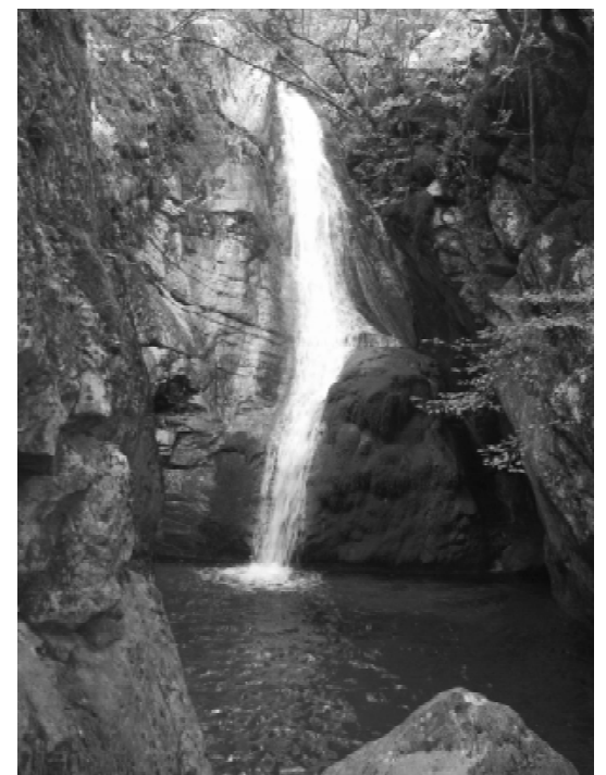
Καταράχτης στη Μαύρη Σπηλιά Προυσού

Στη συνέχεια επισκεφτήκαμε το Παλιό Μικρό Χωριό και ακολουθήσαμε τον ανηφορικό χωματόδρομο, ανάμεσα στα έλατα και τα πλατάνια με τα εξαισία φθινοπωρινά χρώματα, μέχρι το εκκλησάκι του Άγιου Σώστη, θαυμάζοντας την κορυφή της Χελιδόνας! Στην επιστροφή μια ζεστή ταβερνούλα στην