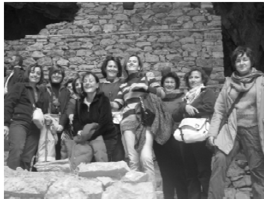
Αναμνηστική φωτογραφία στη Μαύρη Σπηλιά

έργο τέχνης! Ένα από τα πιο εντυπωσιακά σημεία του δρόμου, η θέση «κλειδί» ένα στενό πέρασμα μέσα απ' το βουνό, με τα αυτοκίνητα σχεδόν να ξύνουν το βράχο, κόβει κυριολεκτικά την ανάσα, ενώ λίγα μέτρα πιο κάτω διακρίνεται το «τύπωμα» της Παναγίας. Πρόκειται για σημάδια που βρίσκονται πάνω σ' ένα απότομο βράχο στην άκρη του