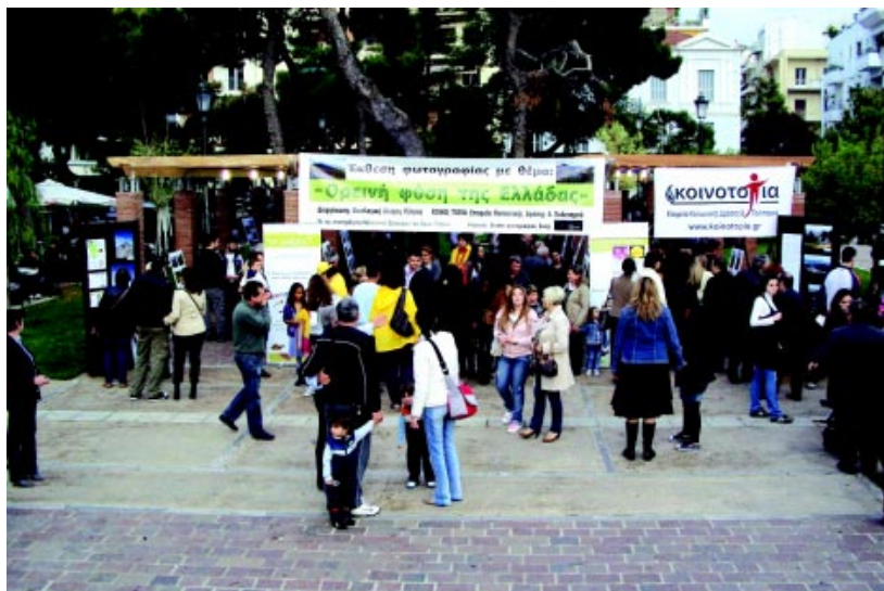
Αποψη του χώρου της έκθεσης στα Ψηλά Αλώνια

Χιλιάδες συμπολίτες μας επισκέφτηκαν τη δεύτερη έκθεση φωτογραφίας που συνδιοργανώσαμε (η ΟΙΚΙΠΑ και η «ΚΟΙΝΟ_ΤΟΠΙΑ») στα Ψηλαλώνια την παραμονή της Πρωτομαγιάς, η οποία ήταν ενταγμένη στις εορταστικές εκδηλώσεις που οργάνωσε ο