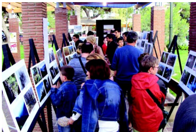
Χιλιάδες Πατρινοί επισκέφτηκαν την έκθεσή μας και θαύμασαν τις ομορφιές της ορεινής φύσης

Η έκθεση ανέδειξε ακόμη με χαρακτηριστικό τρόπο τόσο τη σπάνια ομορφιά της Ελληνικής ορεινής φύσης όσο και την ανάγκη προστασίας της. Η ΟΙΚΙΠΑ και η ΚΟΙΝΟ_ΤΟΠΙΑ διοργανώνουν συχνά οικοτουριστικές εξορμήσεις στην Ελληνική ύπαιθρο, γνωρίζοντας από κοντά τις αξίες της και αποτυπώνοντας με το φωτογραφικό φακό των μελών και φίλων τους τη μοναδική ομορφιά της.