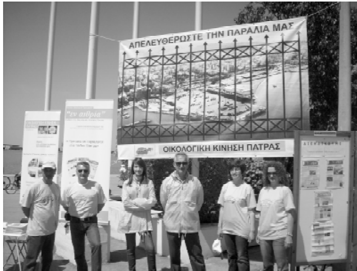
Η ΟΙΚΙΠΑ στην κινητοποίηση για το θαλάσσιο μέτωπο

Προτείνονται εκ των υστέρων γραφειοκρατικές διαδικασίες που όφειλαν να είχαν δρομολογηθεί προ πολλού, με