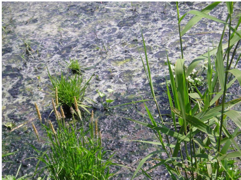
Υγρά λύματα σε χώρο κοντά στο ξενοδοχείο "Πόρτο Ρίο"

Γενικό έλεγχο των ξενοδοχειακών μονάδων της παραλιακής περιοχής της Αχαΐας έχει ήδη ξεκινήσει η Διεύθυνση Δημόσιας Υγείας Αχαΐας της Περιφέρειας Δυτ. Ελλάδας σε ότι αφορά την λειτουργία των αποχετευτικών συστημάτων και βιολογικών τους καθαρισμών.