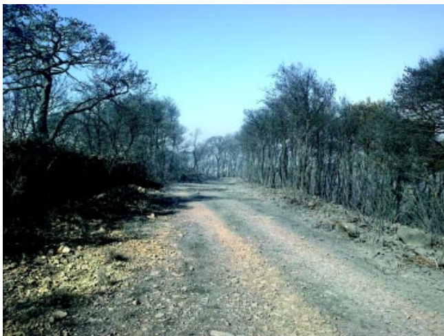
Εικόνα από τα πρόσφατα καμένα στη Ζάκυνθο

πόδοση προτεραιότητας στην φυσική αναγέννηση των περιοχών αυτών. Ιδιαίτερα για την προστατευόμενη περιοχή των Μαύρων βουνών η γνώμη του Φορέα Διαχείρισης Στροφυλιάς Κοτυχίου ο-