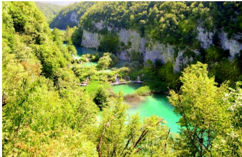
Λίμνες Πλίτβιτσε: Η μαγεία της φύσης

Επιμέλεια αφιερώματος: Κορίνα Αλιβιζάτου