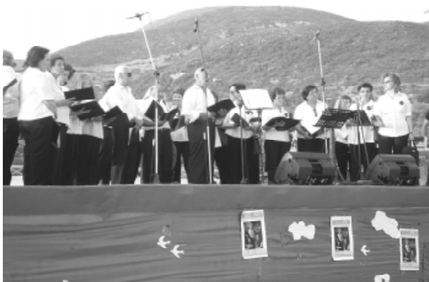
Στιγμιότυπο από την εκδήλωση του συλλόγου της Χαλανδρίτσας