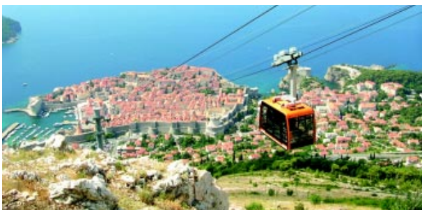
Όταν κοιτάς (το Ντουμπρόβνικ) από ψηλά...