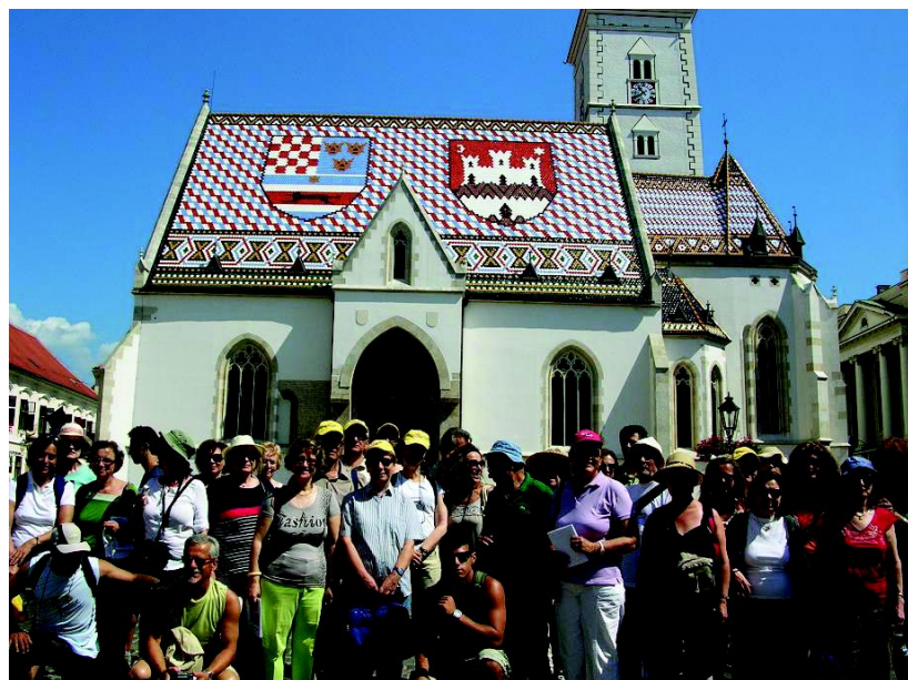
Μπροστά στην εκκλησία του Α.Μάρκου, Ζάγκρεμπ

Το νησί αυτό επαίρεται ως πατρίδα του Μάρκο Πόλο και ένα γεροκτισμένο δίπατο σπίτι, διατηρημένο ανέπαφο ανά τους αιώνες, επιδεικνύεται ως πατριό του.