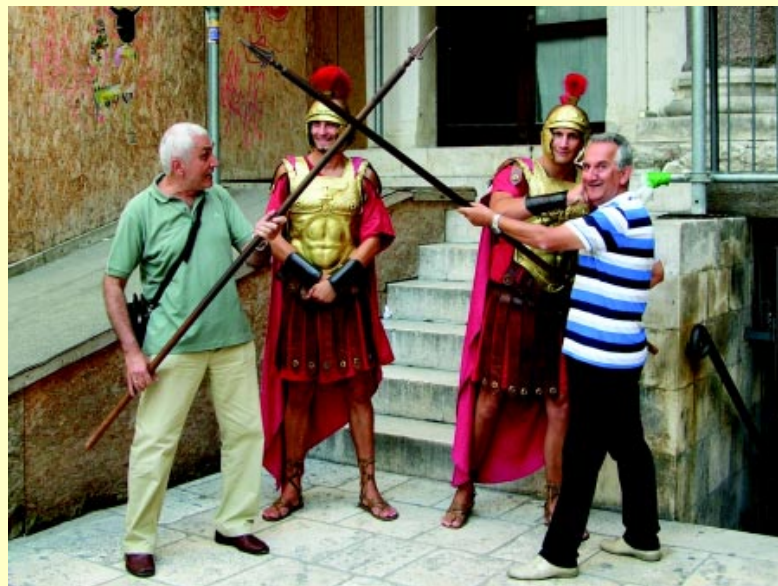
Ο αγώνας για την αρχηγία (της ΟΙΚΙΠΑ) ανελέητος!

* Απορία: Πως γίνεται και σε κάθε ταξίδι, ο συνήθης μπαμπάς του λόχου μας, σημειωτέον δίμετρος, να βραχνιάζει από το πρώτο μισάωρο κάθε ταξιδιού, είναι απορία άξιον... Έρανος για ντουντούκα επειγόντως! Κι ένα τσαγάκι με μέλι